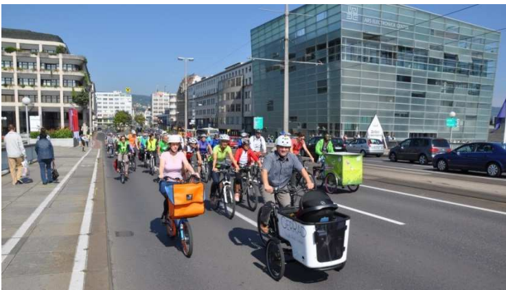
Eindrücke von der Linzer Rad-Parade

Aktuelle Informationen wie Treffpunkte der Sternradfahrt und das Programm der Rad-Parade mit Umweltzirkus sind auf www.radlobby.at/sternradln zu finden.